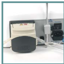
Pompa con facile inserzione del tubo d'irrigazione. Pump with easy insertion of the irrigation set.