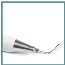
Manipolo ad alta potenza con spray interno. High power handpiece with internal spray.