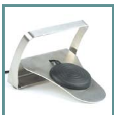
Pedale pneumatico utilizzabile anche in sala operatoria. Pneumatic footswitch.