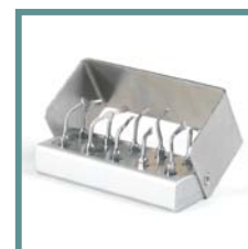
Kit portainseriti completo di 6 inserti (5 taglienti, 1 levigante). Kit with 6 insert tips (5 sharp, 1 smoothing).