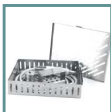
Surgical tray. Surgical tray.